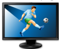
Canales de pago